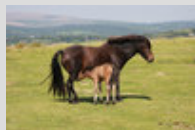
Une jument Dartmoor et son poulain au pâturage