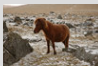
Le Dartmoor en liberté pendant l'hiver