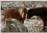
Le Dartmoor en liberté pendant l'hiver