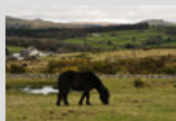
Un Dartmoor au pâturage