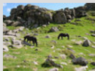
Le Dartmoor en liberté