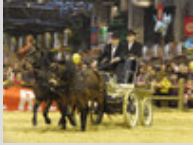
Le Dartmoor à l'attelage au Salon de l'Agriculture en 2014