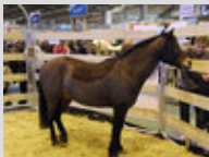
Un Dartmoor dans un paddock lors du Salon de l'agriculture en 2010