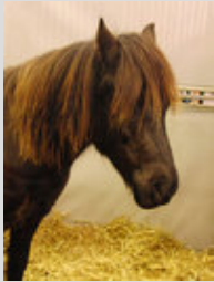
La tête d'un Dartmoor