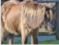
Un Dartmoor au pré portant son poil d'hiver