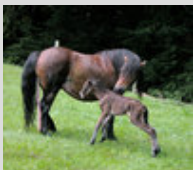
Un jument Dartmoor qui vient de mettre bas à côté de poulain poulain debout

Grâce à sa force, il est toutefois capable, de porter un adulte, tout en gardant à l'esprit qu'il s'agit d'un poney sur lequel un cavalier avec grand gabarit pourrait être trop lourd pour lui, ces derniers pourront tout de même l'utiliser sans aucun problème à l'attelage.