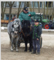
Le Dartmoor à l'attelage

Les années 1930 vont permettre à la race de se consolider, mais à la suite de la Deuxième Guerre Mondiale (1939 à 1945) il ne restera que très peu d'individus enregistrés. C'est à cette période que l'inscription avec inspection sera introduite et les gagnants des divers salons sélectionnés, seront automatiquement acceptés. Les temps difficiles n'empêcheront pas le Dartmoor d'avoir ses bons moments avec l'arrivée de « Jude » en 1941, de « Quennie XX » en 1943, de « John » et « Linnet » en 1944 et de « Jenny VII », « Betty XXI », « Chymes » et « Honeybags » en 1945, qui joueront un rôle fondamental dans l'évolution de la race. Les célèbres étalons « Pipit », « Janus » et « Jon », des progénitures de « Jude », et les merveilleuses juments « Quennie XXIII », « Cherrybrook », « Hele Judith » et « Halloween II » feront leur apparition peu de temps après.