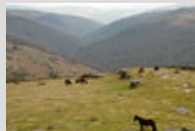
Le Dartmoor en liberté dans le Parc National du même nom