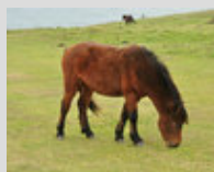
Le Dartmoor au pâturage en liberté