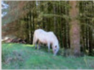
Un Dartmoor au pâturage