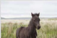
La tête d'un poulain Dartmoor