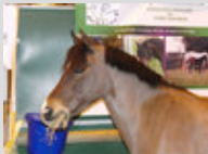
La tête d'un Dartmoor lors du Salon de l'Agriculture en 2010