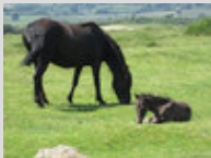
Une jument Dartmoor au pâturage à côté de son poulain couché dans l'herbe