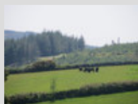
Le Dartmoor au pâturage