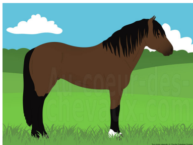
Le Dartmoor un poney originaire du Royaume Uni

Avec des origines très mystérieuses, les premières traces du Dartmoor remontent à l'année 1012 lorsque l'évêque Aelfwold de Crediton inclua dans son testament un poney de la race. Beaucoup plus tard, entre le XII ème siècle et le XV ème siècle lors de l'apogée des mines d'étain de Dartmoor, les poneys étaient privilégiés pour le transport de l'étain vers les villes de Stannary, mais lorsque l'étain ne fut plus aussi convoité, ces poneys furent livrés à eux-mêmes, mis à part ceux utilisés dans les fermes pour les travaux des champs.