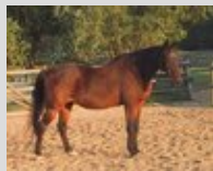
Un Anglo Kabardin en liberté