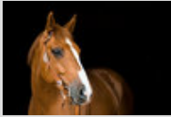
La tête d'un cheval avec un bridon western à passage d'oreilles