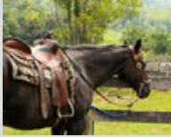
Un cheval avec un harnachement western