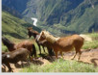
Le Chumbivilcano en liberté dans les montagnes avec des mules